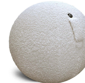
MHBALL F BLANC