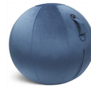
MHBALL VB BLEU PRESTIGE