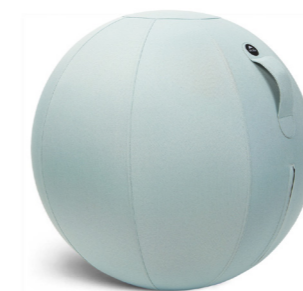
MHBALL V VERT D'EAU