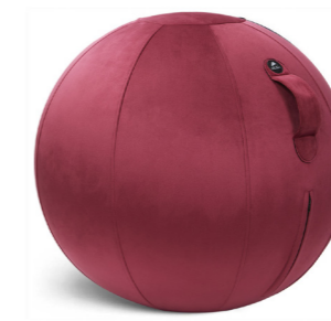
MHBALL VR ROUGE SAPHIR