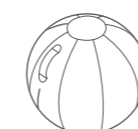
HOUSSE DE REVÊTEMENT