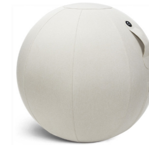
MHBALL BE BEIGE