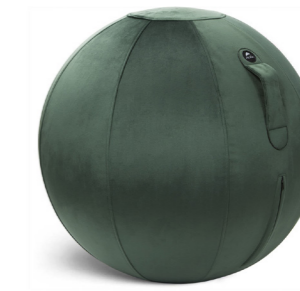
MHBALL VV VERT EMERAUDE