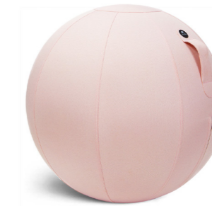
MHBALL R ROSE POUDRÉ