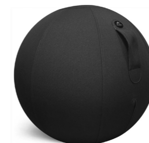
MHBALL N NOIR