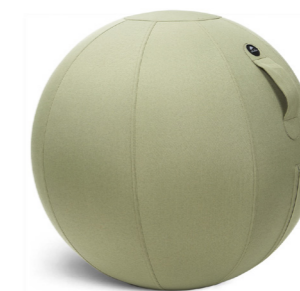
MHBALL K KAKI