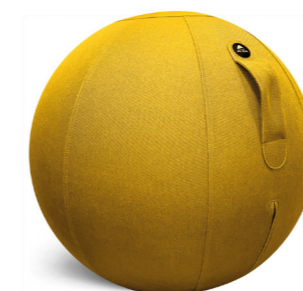
MHBALL J JAUNE SAFRAN