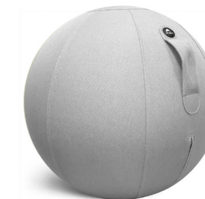
MHBALL G GRIS