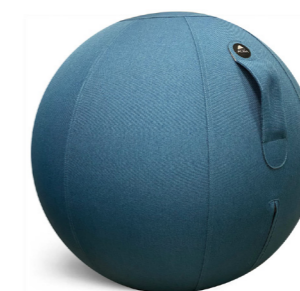
MHBALL B BLEU CANARD